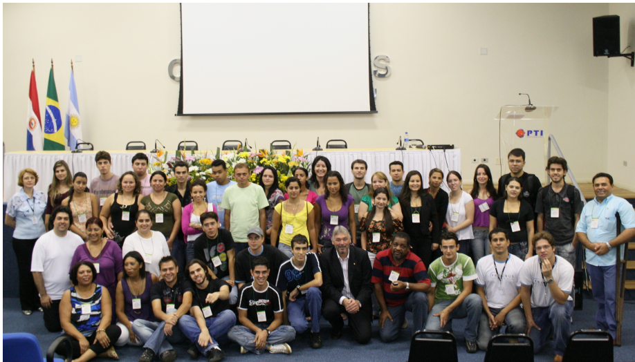
Fotos alunos e convidados

No dia 12 de abril de 2008 conseguimos vencer mais um desafio, iniciou-se o Curso de Capacitação de Informática Básica para os Trabalhadores Terceirizados em Foz do Iguaçu.