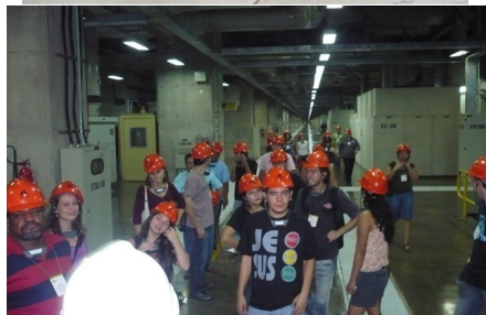
Visita técnica no complexo da Usina de Itaipu

Enfim agradecemos aos Órgãos do Governo e pessoas que não estão envolvidos com esta situação, mas, estão dando uma lição de cidadania e inclusão social.